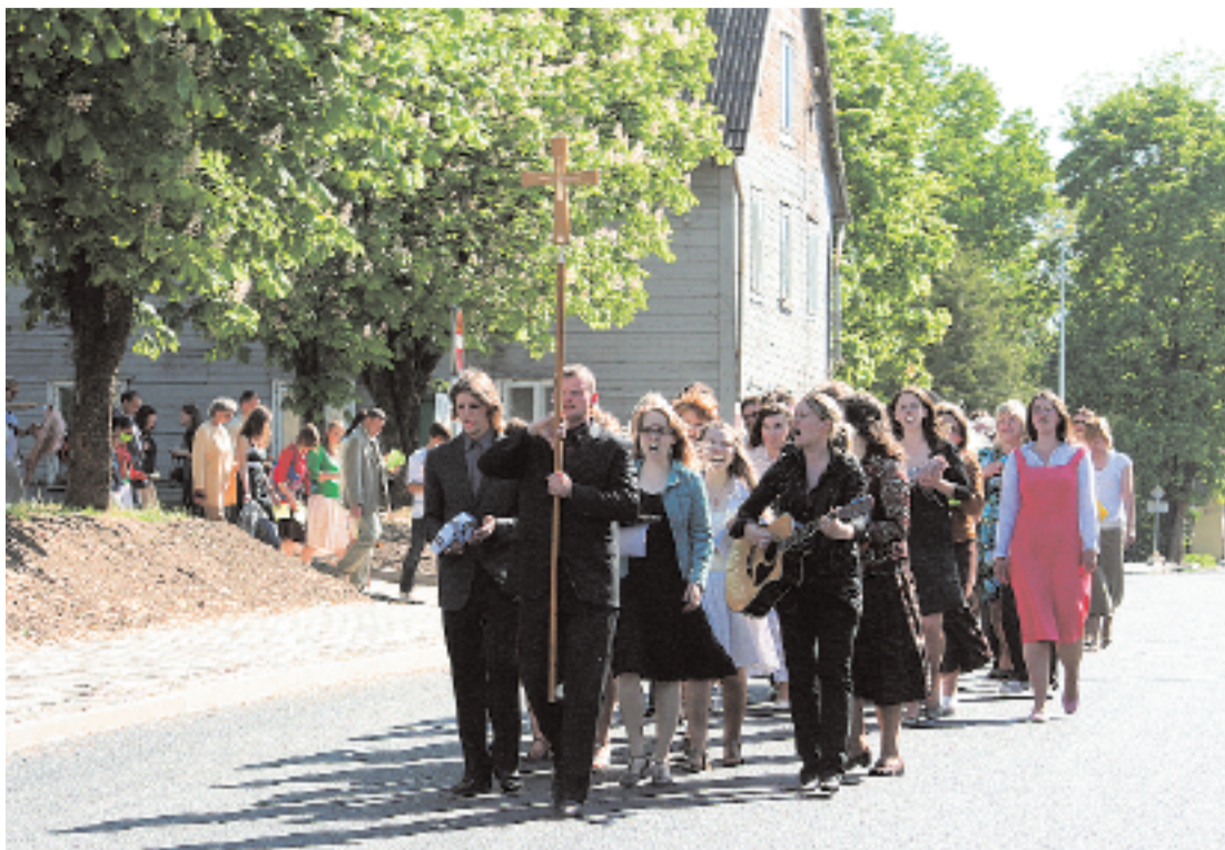
Svinīgā procesija no skolas uz Sv.Jāņa baznīcu