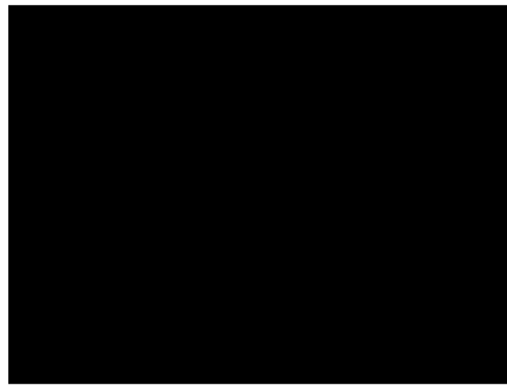
Penkules baznīcā vairs nevajadzēs salt – pie zāles sienām izvietoti 4 infrasarkanā staru sildītāji

Vairāk informācijas: Edgars Bukavs tālr. – 29181600.