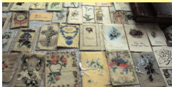
Seno iesvētību kartiņu izstāde